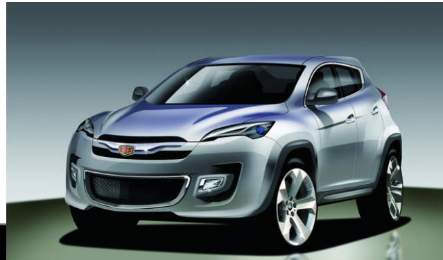
Geely NL SUV