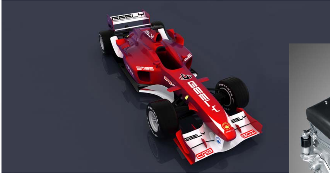
Geely GF Formula Car