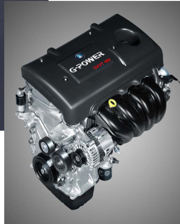
Geely JL4G18 CVVT Engine