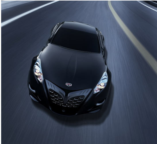
Geely GT Sport Car